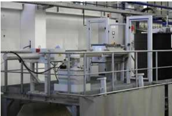
Bild 3: Stationäre Anlage zur Filtration von Schleifschlamm aus der Produktion von Betonfertigelementen Typ II