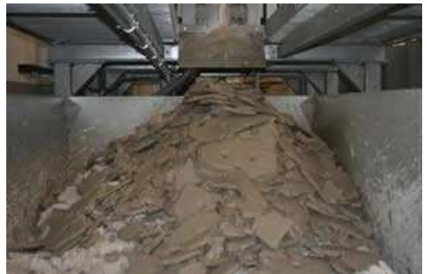
Bild 4: Filterkuchen nach erfolgter Filtration von Betonschleifschlamm im Container

MSE Filterpressen GmbH ist führender Hersteller kundenspezifischer Kammerfilterpressen. Die Produktpalette umfasst Kammerfilterpressen, Membranfilterpressen sowie Mobile-Filterpressen und Heißfilterpressen. Langjährige Erfahrung, hochqualifizierte Mitarbeiter für Konstruktion und Fertigung sowie komplette Produktion im Stammwerk in Remchingen bei Karlsruhe (BW) garantieren höchste Qualität. Spezialisten vor Ort optimieren die Filtration von Anlagen auf die speziellen Bedürfnisse des Anwenders. Das inhabergeführte Unternehmen garantiert kurze Entscheidungsprozesse. Kompetente Ansprechpartner von der Konstruktion bis zum Montage- und Wartungspersonal bieten bei Bedarf schnellen Service