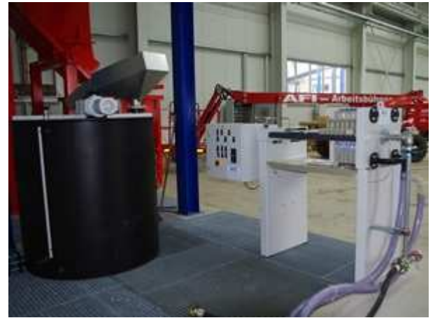
Bild 1: Stationäre Anlage zur Filtration von Schleifschlamm aus der Produktion von Betonfertigelementen Typ I

Hierfür hat MSE Aufbereitungsanlagen als Kompaktanlagen entwickelt. Die aus Filterpresse, Beschickungspumpe, Schlammspeicher mit Grobstoffabscheider, sowie allen weiteren notwendigen Aggregaten bestehenden Anlage haben sich in der Praxis bereit sehr gut bewährt.