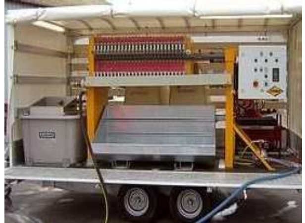
Bild 2: Mobile Anlage zur Filtration und Separation von Betonschlämmen z.B. im Strassenbau